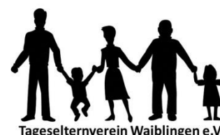
Tageselternverein Waiblingen e.V.