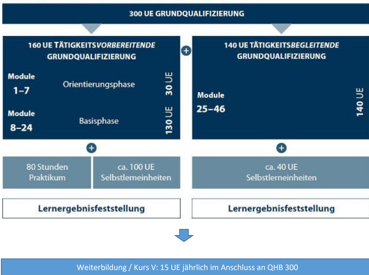
Abbildung: Aufbau der Grundqualifizierung nach dem QHB